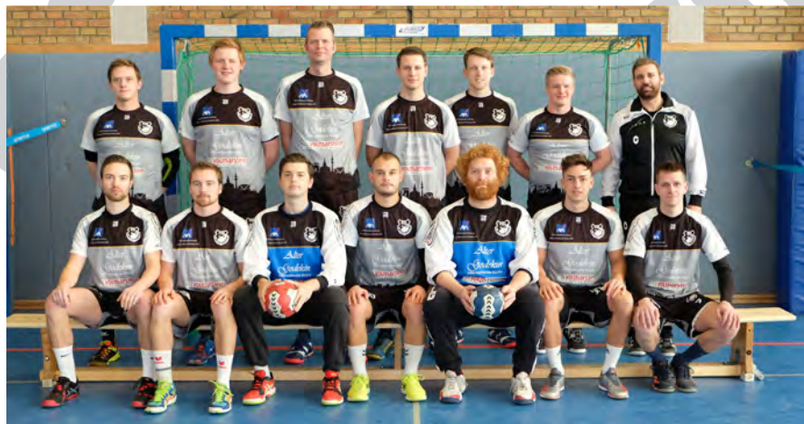
TuS Do-Wellinghofen Landesliga 2018 / 2019

▶▶▶ Sporthalle Kreuzstraße ◀◀◀ 44137 Dortmund, Kreuzstr. 161