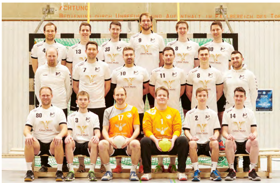
Handball-Herrenmannschaft des TuS Dortmund-Wellinghofen