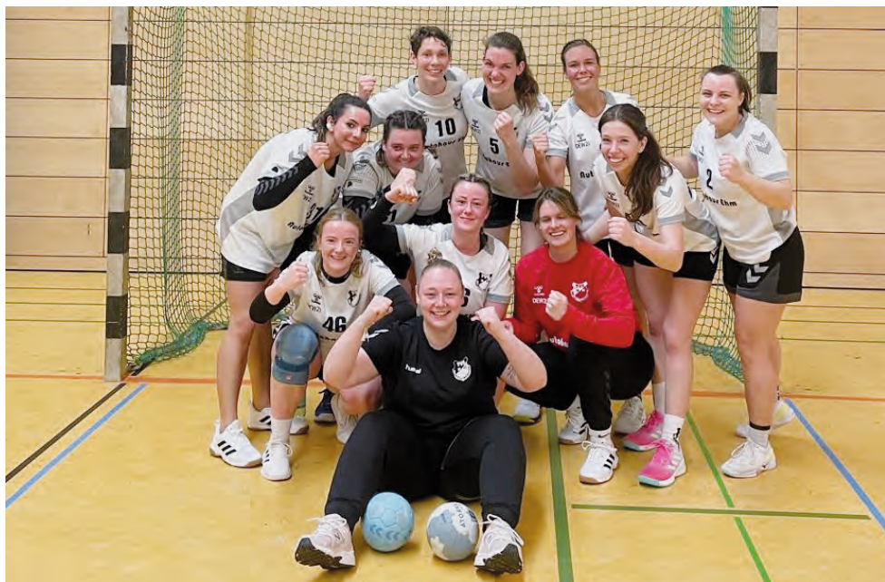
Das Handball-Damenteam – Saison 2023/24