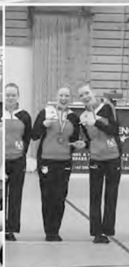
Belgian Open 2024