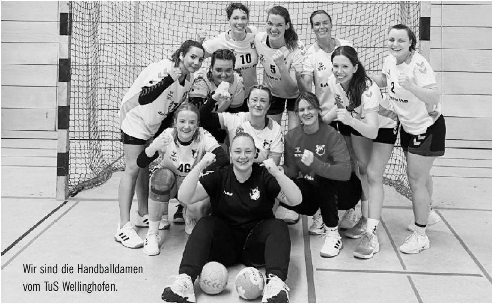
Wir sind die Handballdamen vom TuS Wellinghofen.