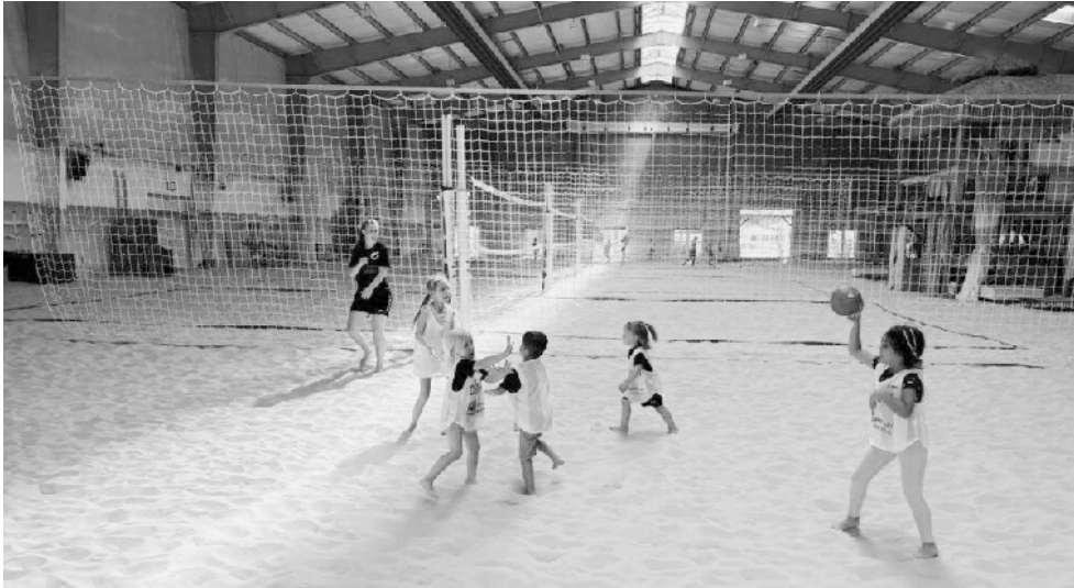
22. Juli 2024 Beach Handball Witten