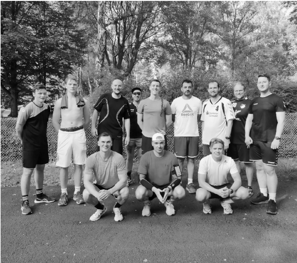
Herren nach Trainingseinheit

Nachdem wir 2023/24 die erste Saison in der Dortmunder Kreisliga erfolgreich abgeschlossen haben, liegt das oberste Ziel nun in der Festigung im mittleren Tabellenbereich, um dort für die Zukunft eine solide Basis aufzubauen. Das Zusammenspiel aus Teamgeist, Ehrgeiz und einem abwechslungsreichen Training bildet das Fundament für unseren Erfolg auf und neben dem Spielfeld.